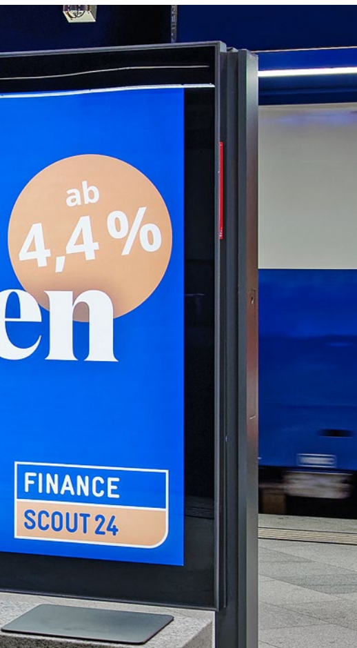
Werbeplakat für Financescout24.ch: Andere Vergleichs- plattformen bieten zurzeit deutlich mehr

schaft Mobiliar gehört, will Finance- scout24 damit bekannter machen.